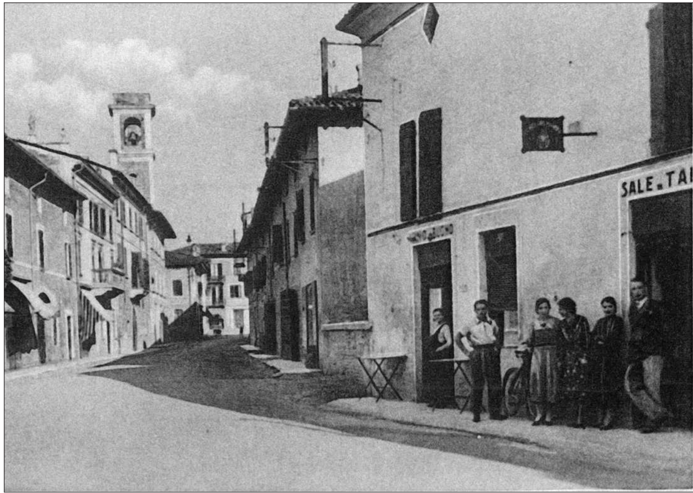
Leno - Via Cavour