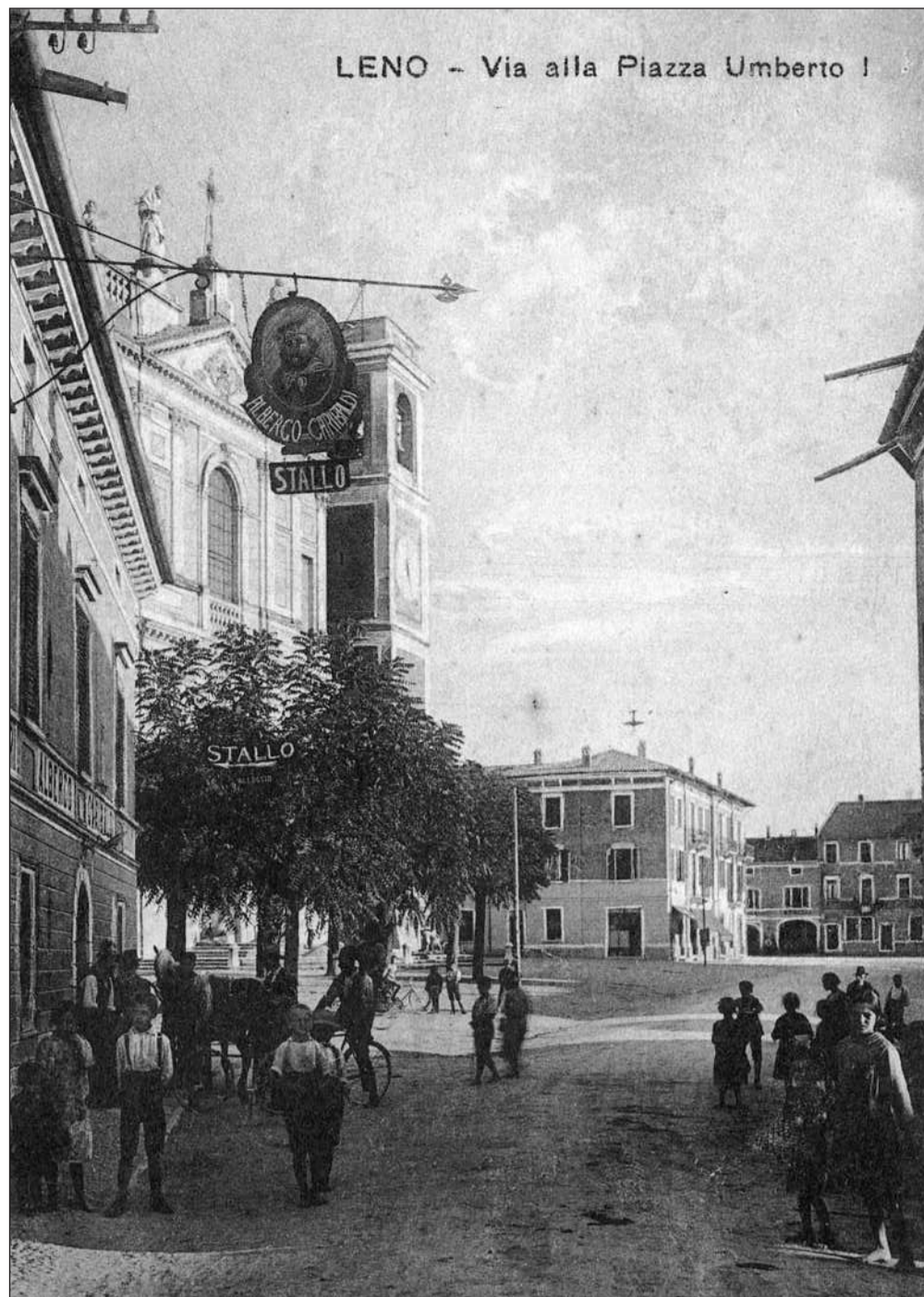
Leno - Via alla Piazza Umberto I cartolina spedita il 22 luglio 1927