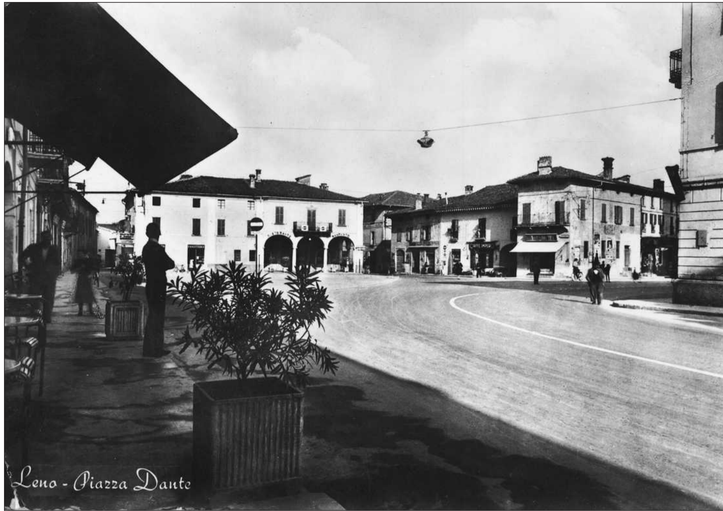
Leno - Piazza Dante