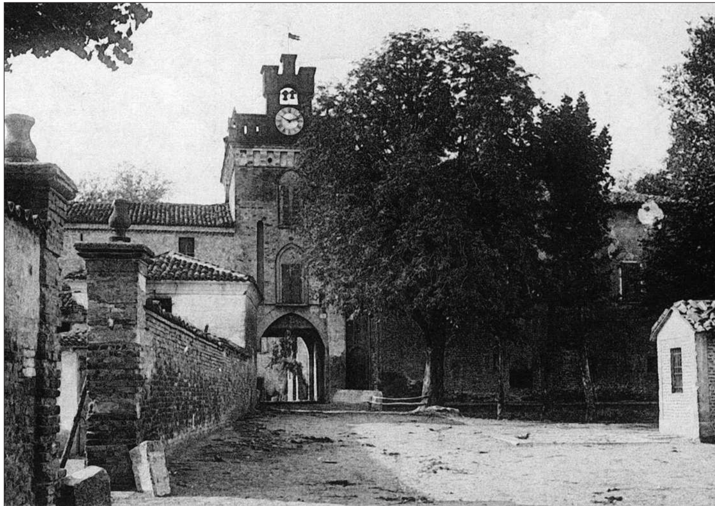
Castelletto di Leno - il Castello cartolina del 1924