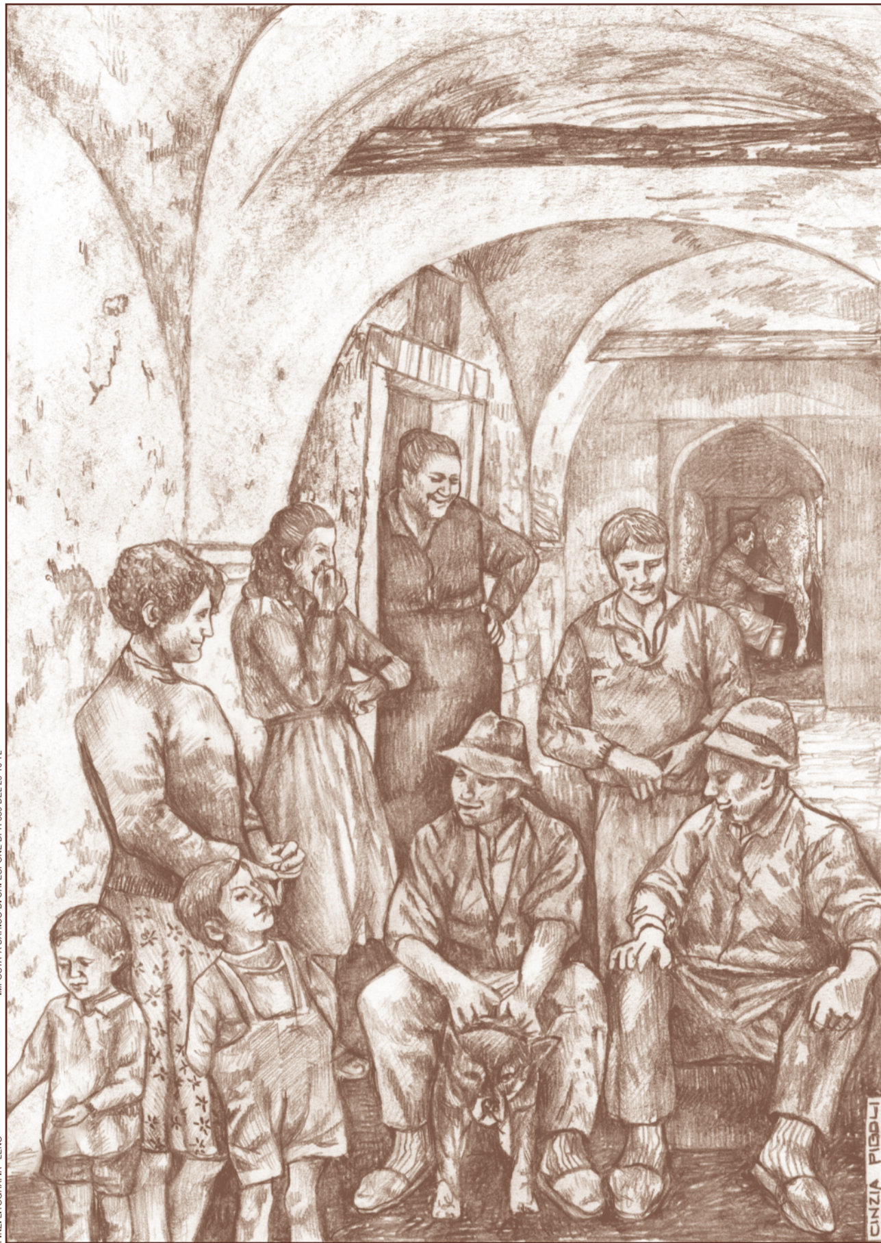
IMPASTA A CARICO DI CHI ESPONE DPR 681 DEL 28-10-72