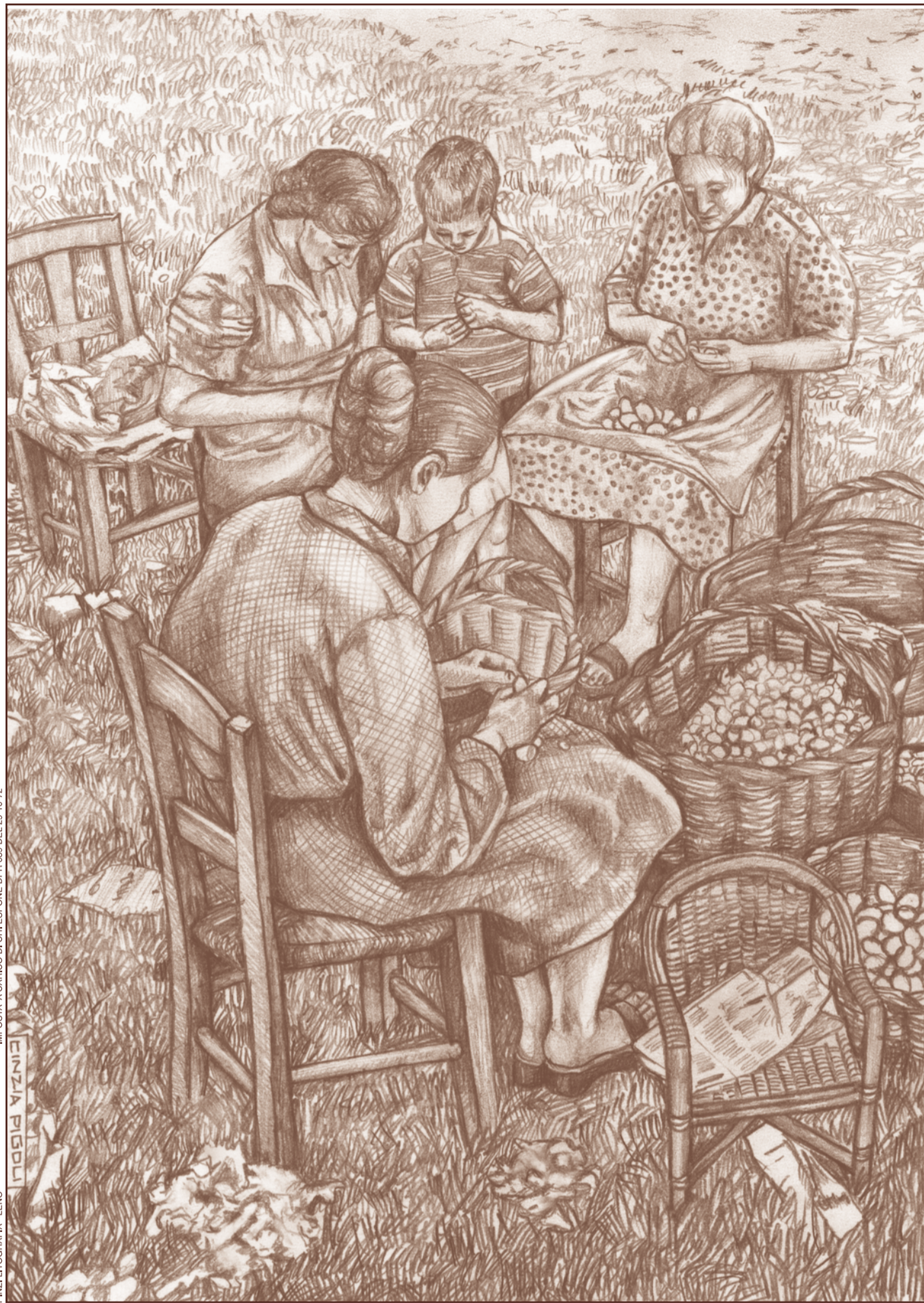
IMPOSTA A CARICO DI CHI ESPONE DPR 639 DEL 26-10-72 PINZI LITOGRAFIA - LENO